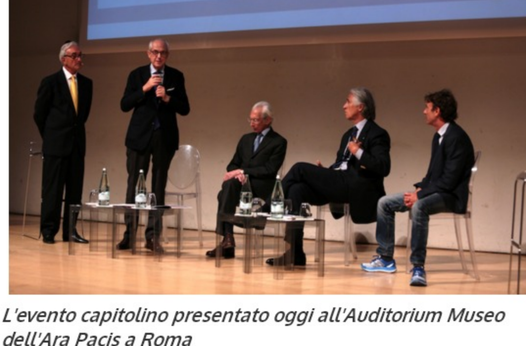
L'evento capitolino presentato oggi all'Auditorium Museo dell'Ara Pacis a Roma

Presentata all'Auditorium Museo dell'Ara Pacis l'84ma edizione del Concorso Ippico Internazionale Ufficiale di Roma Intesa Sanpaolo - Piazza di Siena Master fratelli d'Inzeo . Cinque giornate di gara dal 25 al 29 maggio con un tema dominante: modernità e tradizione, come ha sottolineato il Presidente della FISE Vittorio Orlandi : "Guardando al futuro di questo straordinario evento vogliamo riportare a Piazza di Siena certi valori che si sono dimenticati. E dunque accanto alle gare di altissimo spessore tecnico che da sempre ci hanno caratterizzato, ecco il ritorno alle care vecchie tradizioni, eleganza e la sfilata dei tradizionali cappelli delle signore nel giorno della Coppa delle Nazioni, oltre la conferma dei caroselli dei Lancieri, dei Carabinieri e dei ragazzi di Villa Buon Respiro". Orlandi non ha naturalmente tralasciato l'aspetto tecnico: "Il meglio delle ultime recenti edizioni. Sarà dura per gli italiani? Certo che sì ma a questi livelli ci sta. Lo spettacolo si fa con i grandi concorrenti e questo è uno spettacolo che tutti ci invidiano. Le vittorie si sudano e questo i cavalieri lo sanno. Poi c'è il concorso, c'è la straordinaria location di Piazza di Siena che fanno il resto."