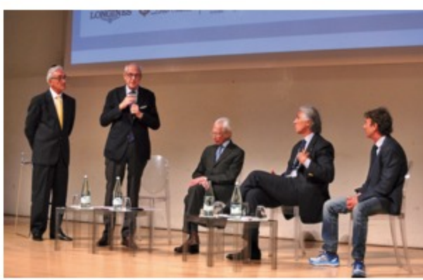
Nella foto: un momento della conferenza

L'evento capitolino presentato oggi all'Auditorium Museo dell'Ara Pacis a Roma