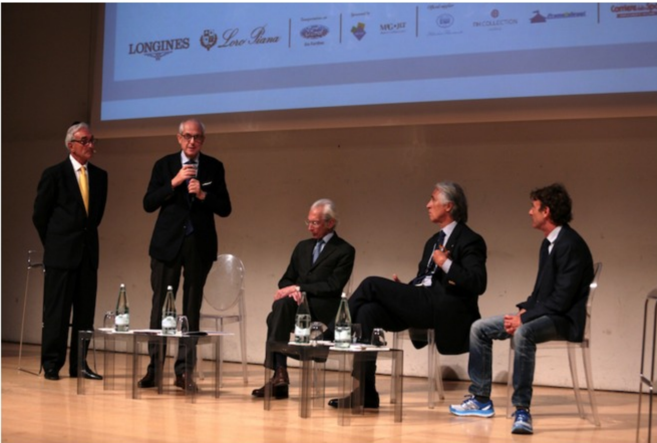
Il tavolo della conferenza stampa di Piazza di Siena