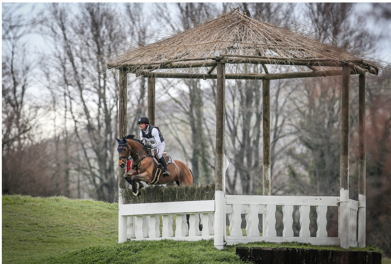
Michael Jung

Per la vittoria seguono la campionessa olimpica in carica, la tedesca Julia Krajewski (8%), i britannici Oliver Townend (8%) e Rosalind Canter (6%) – quest'ultima campionessa del mondo uscente – e la statunitense Tamra Smith (6%).