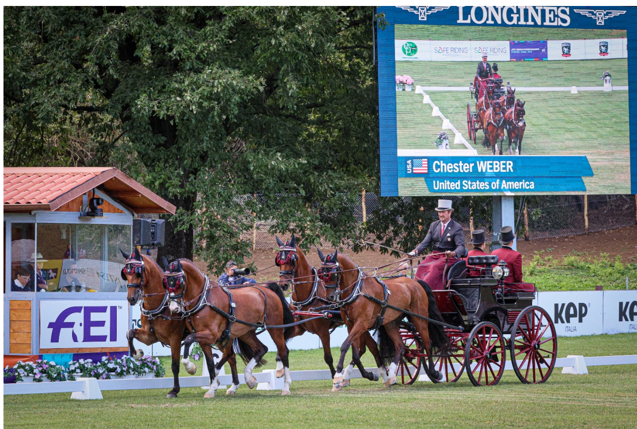
Lo statunitense Chester Weber