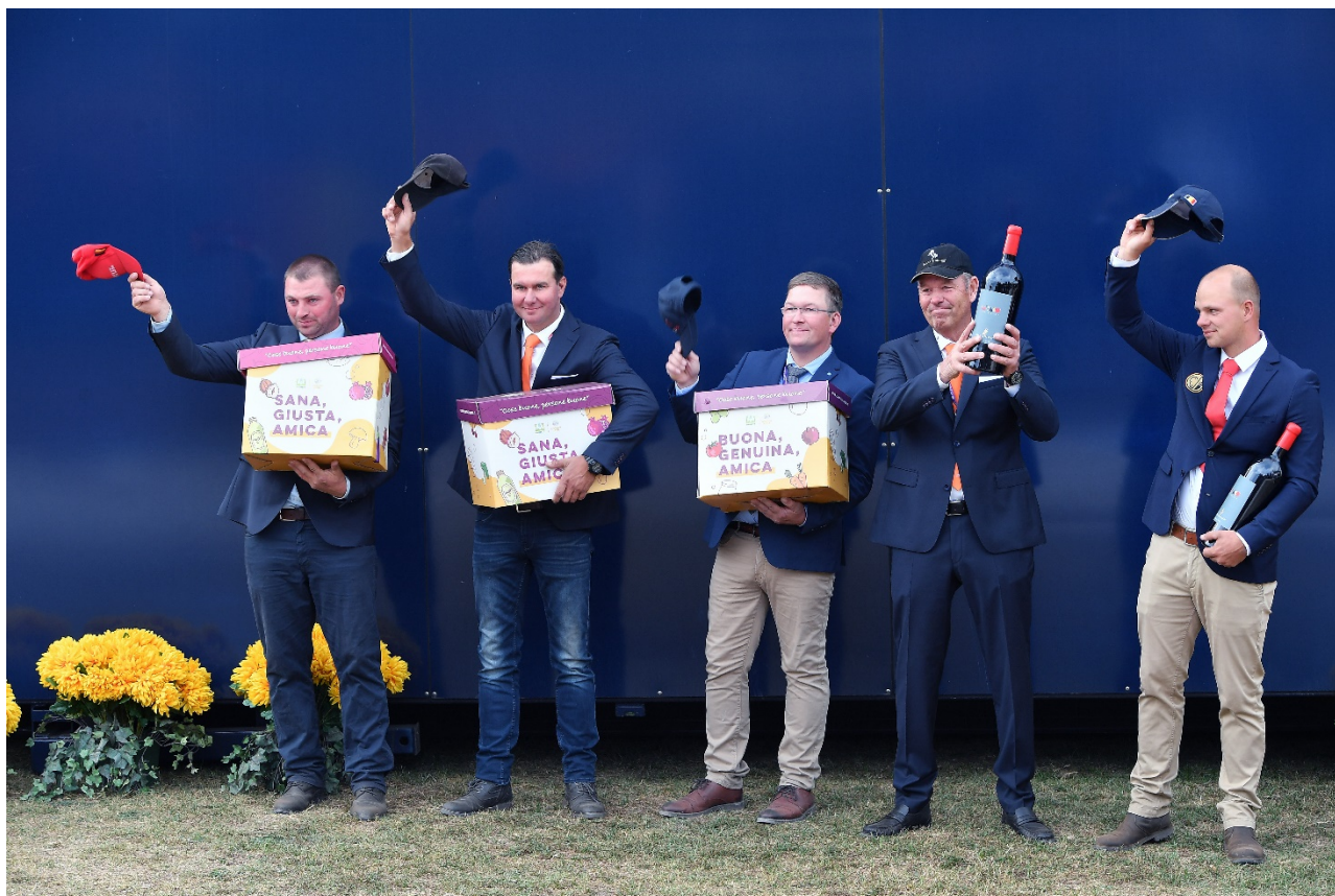
I primi cinque driver della maratona

Nella classifica individuale è invece terzo l'olandese Ijsbrand Chardon (157,4) , che ha recuperato due posizioni rispetto a ieri. Si è difesa bene la tedesca Mareike Harm : seconda dopo il dressage, ha chiuso sedicesima nella maratona (125,02) ed è adesso sesta in classifica (163,87) .